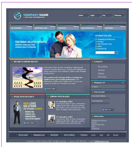
Ejemplo de diseño